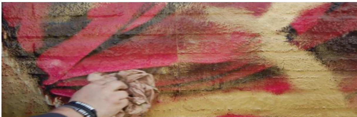
LAG 100 prior to cleaning the graffiti